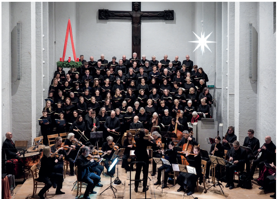
Bachs "Weihnachtsoratorium" mit Kantorei und Orchester in der Wohltorfer Kirche: ganz gross.