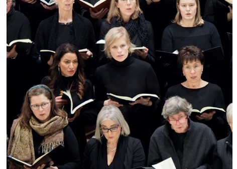
Chordamen der „H-Moll-Messe“: So sieht SINGEN aus.

erwartet Sie. Oder mögen Sie lieber Gospel (Gospel-Gottesdienst z.B. 12.4.2026)? Unsere Kirchenmusik Wohltorf-Aumühle bietet verschiedene Chor-Gruppen, angepasst an unterschiedliche Bedürfnisse und Ziele. Der Zeitpunkt zum Einstieg ist günstig, das Einstudieren der neuen Programme beginnt jetzt im Februar. Und, neben Ihrer Stimme und herrlicher Musik, lernen Sie im Handumdrehen noch viele interessante Menschen kennen, die Sie freudig erwarten! Na dann ... oder?! Vereinbaren Sie gerne einen Termin mit mir. Oder kommen Sie zum „Mitsing-Gottesdienst“ am 8.2.2026 ... eine gute Gelegenheit zum Kennenlernen!