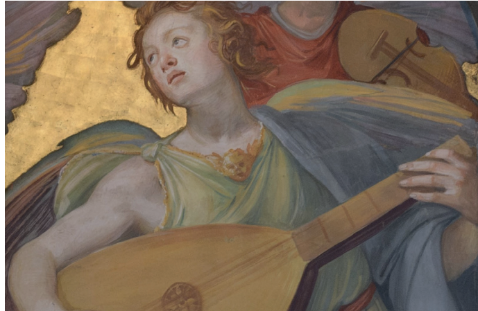
Himmliche Laute, bei John Dowland oft melancholisch.

John Dowland, ein Zeitgenosse Shakespeares, galt als Wunderkind, lernte das Lautenspiel, zu komponieren und hatte eine schöne Stimme. Mit 17 ging er in den Dienst beim englischen Botschafter am Hof des französischen Königs Heinrich IV. in Paris – und ließ sich römisch-katholisch taufen. Keine so gute Idee für eine weitere Anstellung